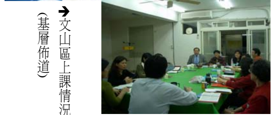
→ 文山區上課情況 (基層佈道)