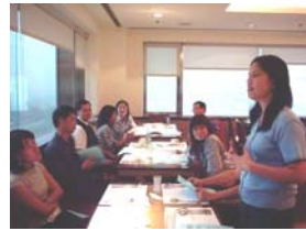
基宣事工順利運作。