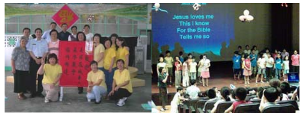
*6月 鳳凰崗聖人短宣隊 弘揚佈道 *7月 Torrance 聖輝堂短宣隊 舉辦英文兒童夏令營