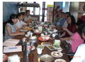
教師輔導老師會議