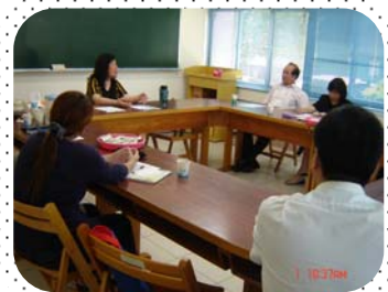
實習教會、機構牧長座談會