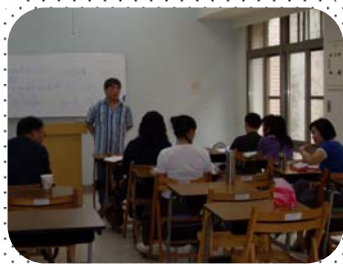
學院學生上課情形