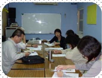
延伸制內湖區學生上課情形