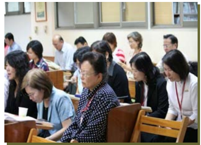
基層機構同工聯合禱告會