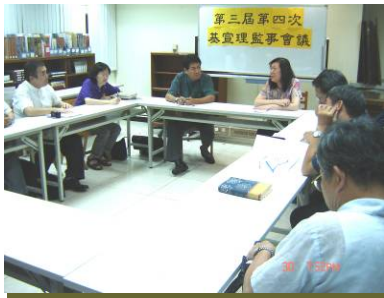
第三屆第四次理監事會議