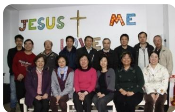
基宣特會籌備單位群英會