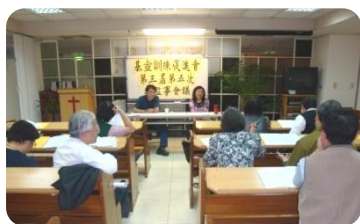
第3屆第5次理監事會議