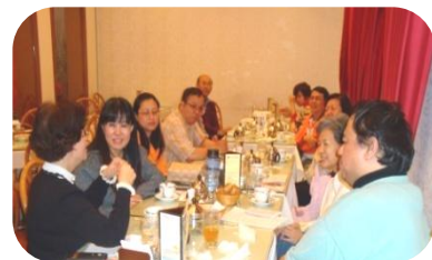
99-100汐止內湖區教輔會議