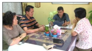
參觀中壢工業福音團契