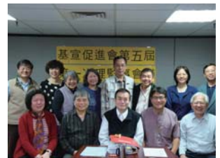
新任理監事們、秘書長、院長