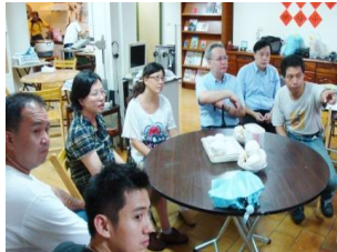
參觀萬華活水泉教會