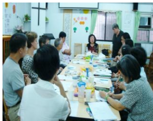
基層福音機構聯禱會