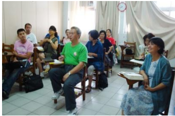
密集課程-自我成長