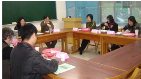
學生實習教會、機構牧長會議

基層宣教訓練學院 招生日期：4月~7月 考試日期：第一次6月22日 第二次8月10日 招生簡章請來電向許傳道索取