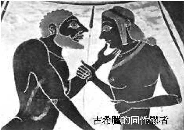
古希臘的同性戀者