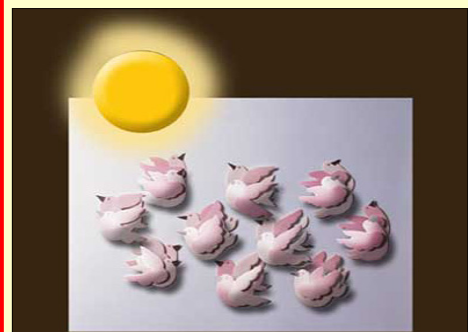
飛鳥不種也不收 天父依然看顧饑饉