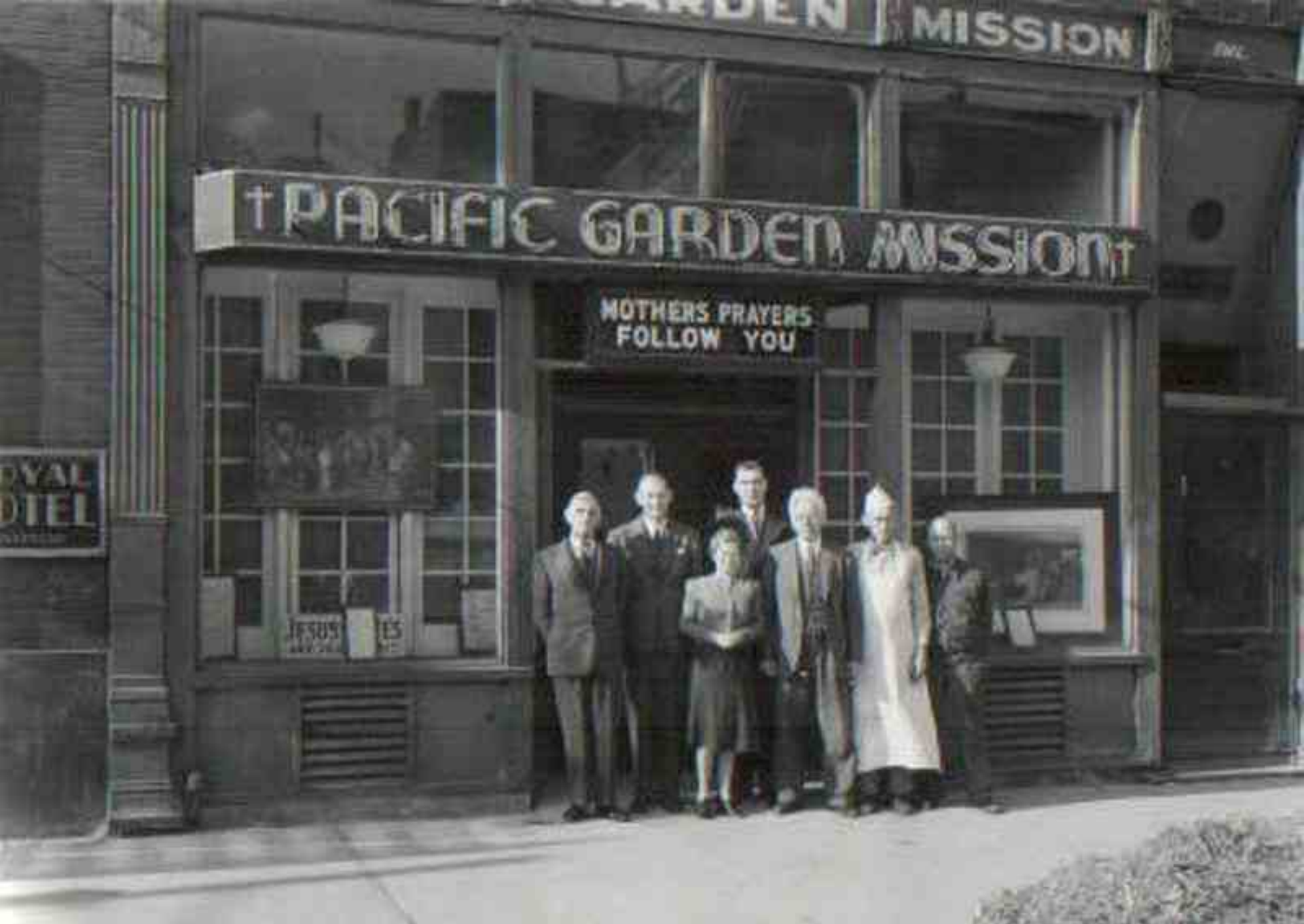
Pacific Garden Mission, 1877