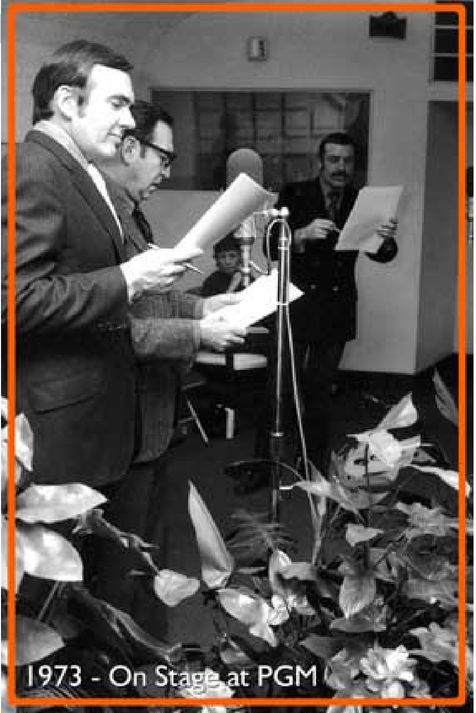
1973 - On Stage at PGM