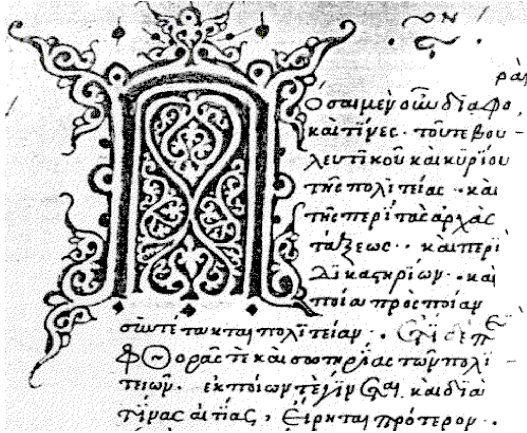
15世紀亞里斯多德的草寫小字