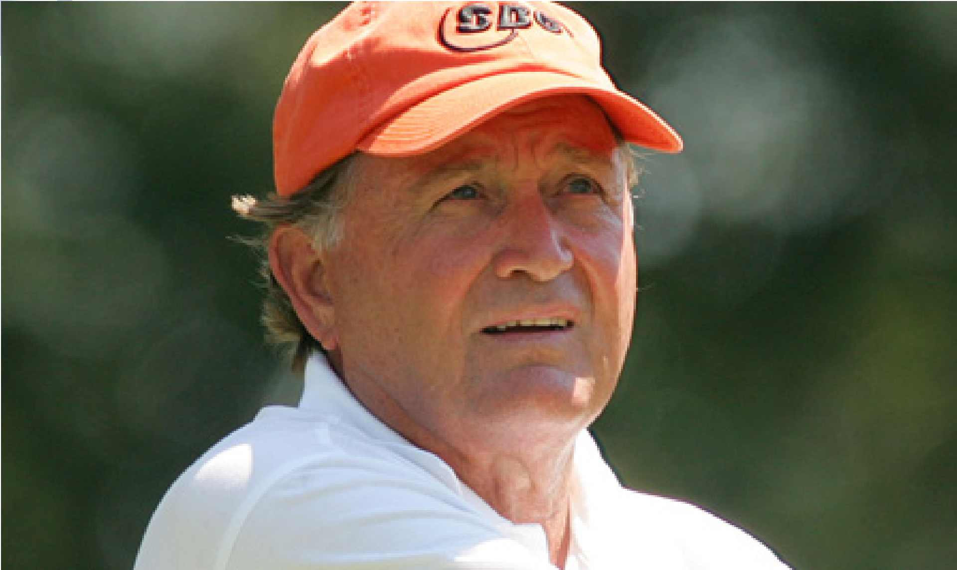
職業高爾夫球選手 Raymond Floyd