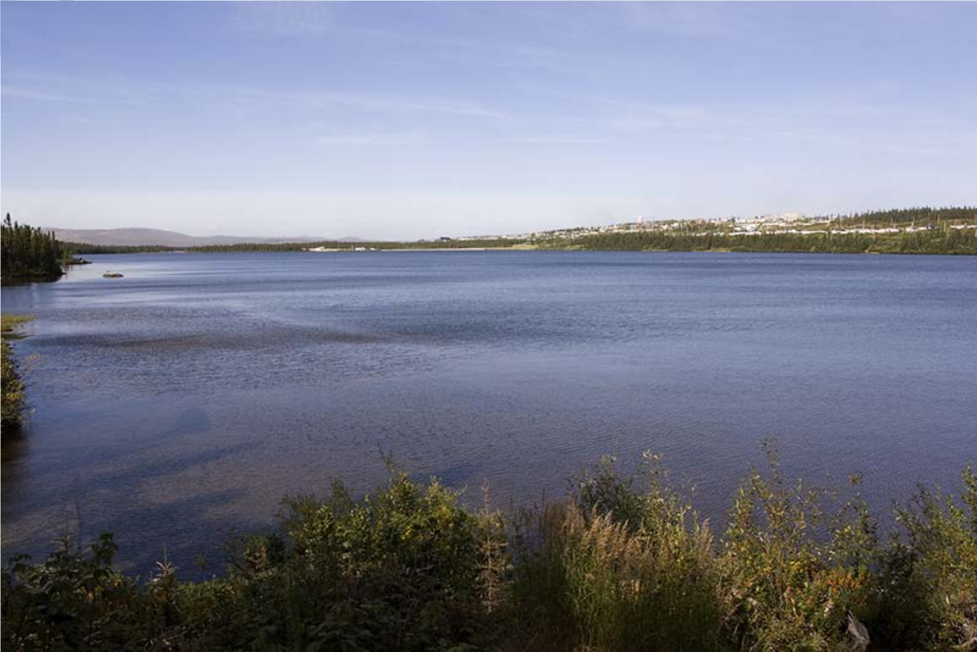
Wabash, Labrador, Canada,