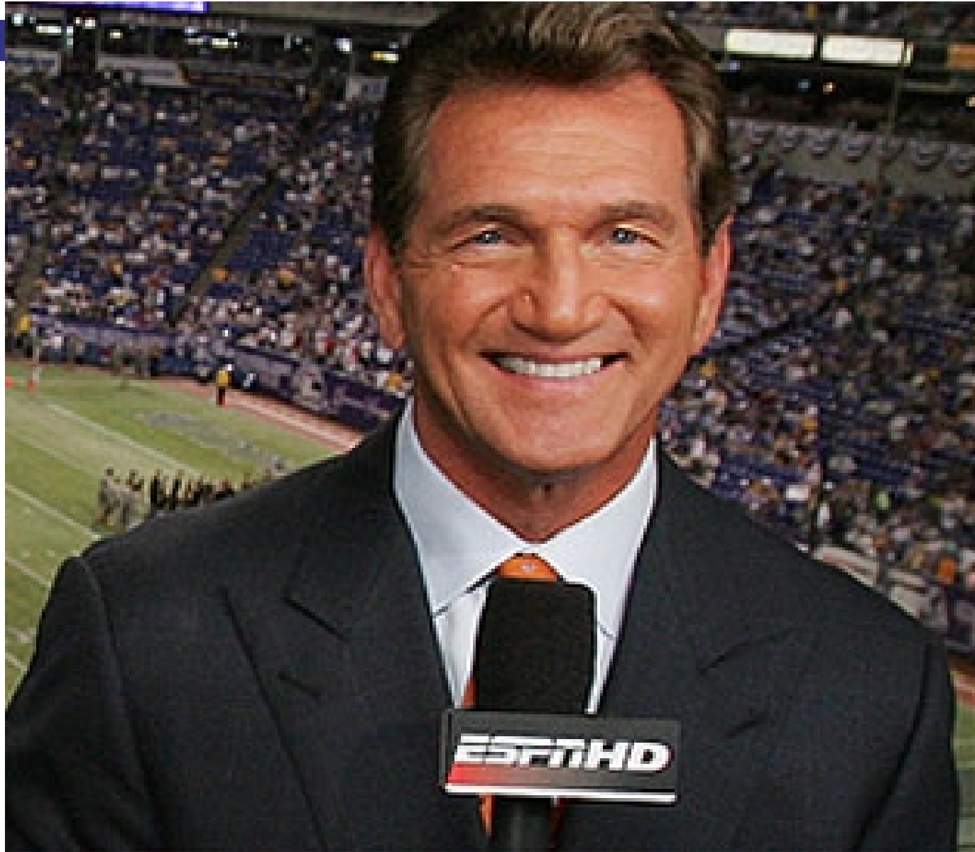
Joe Theismann，美式足球四分衛及評論家 「神要Joe Theismann快樂。」