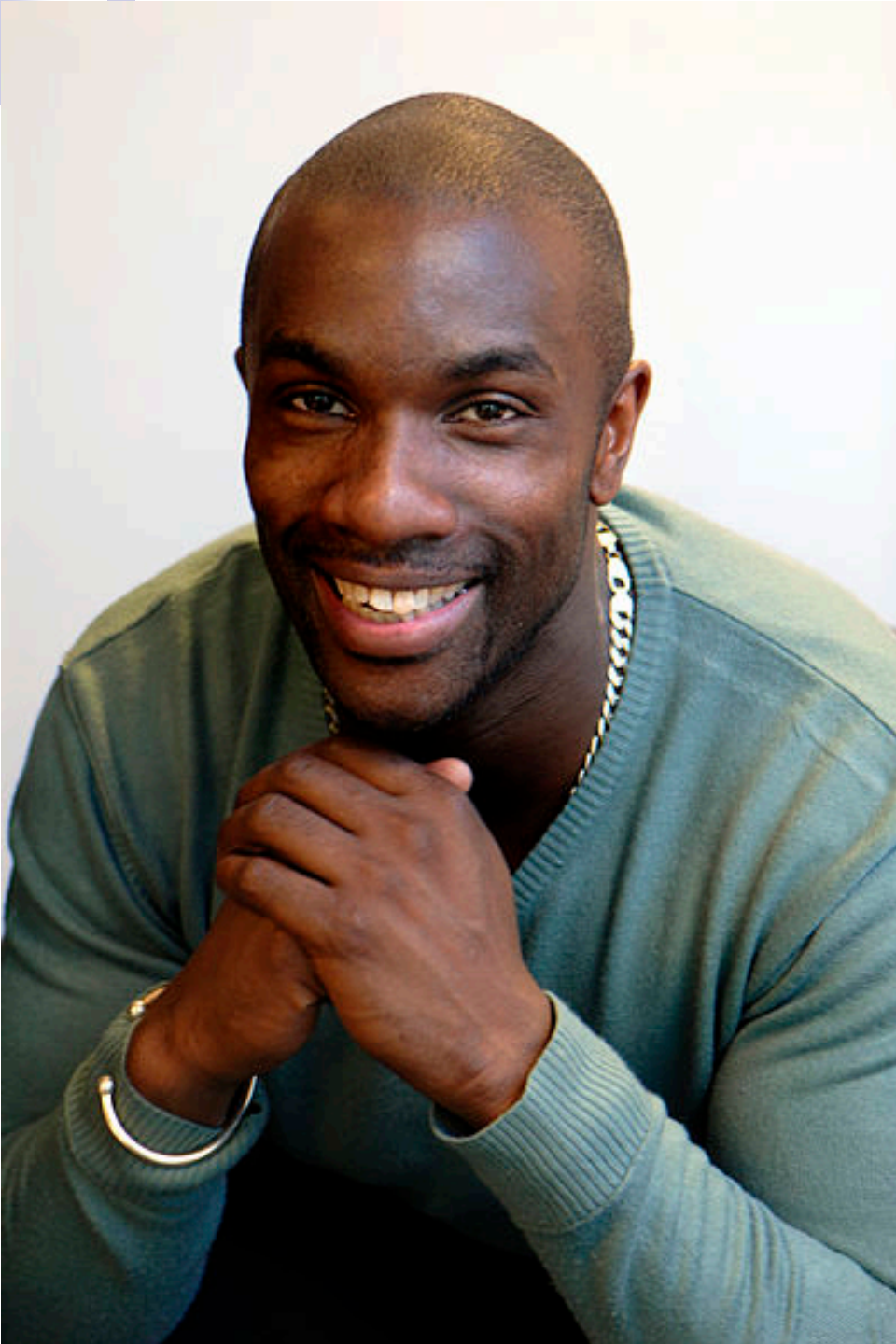
Derek Redmond 英國田徑選手 1992 巴塞隆納奧運