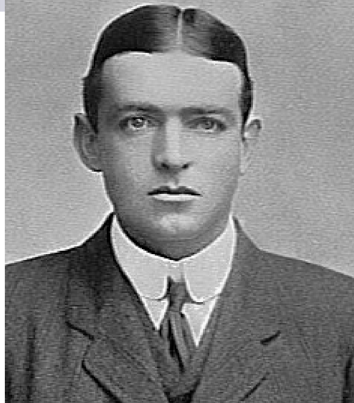
Sir Ernest Shackleton 南極探險家 1874-1922