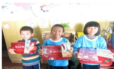
↑ 開心的領取聖誕節禮物 ↓ 音樂會表演&耕水小市集