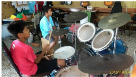
↑禮拜中的爵士鼓及木箱鼓服事