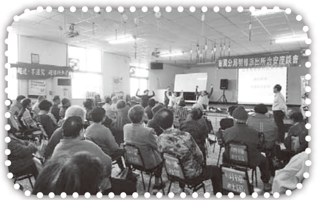
▲在明德活動中心表演魔術。