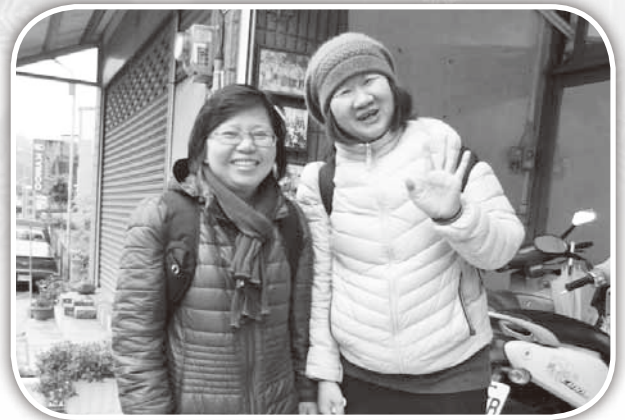
▲美美及櫻玲兩位姐妹多年協助大西兒童事工。