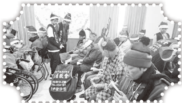
▲與老人家一起玩賓果遊戲。