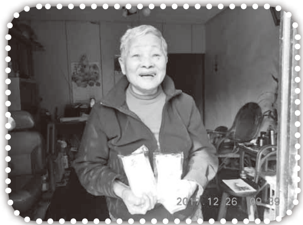
▲收到聖誕糕的村民笑顏逐開。