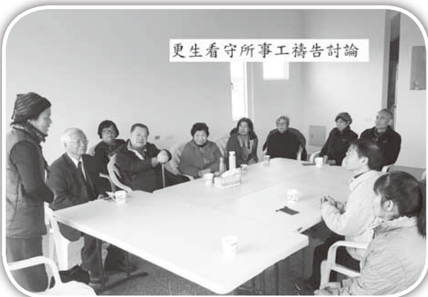
▲參加更生事工禱告會。