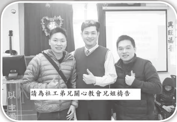
▲社工及慕道友訪問造橋教會。