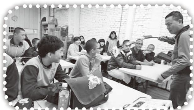
▲在課輔班表演魔術。