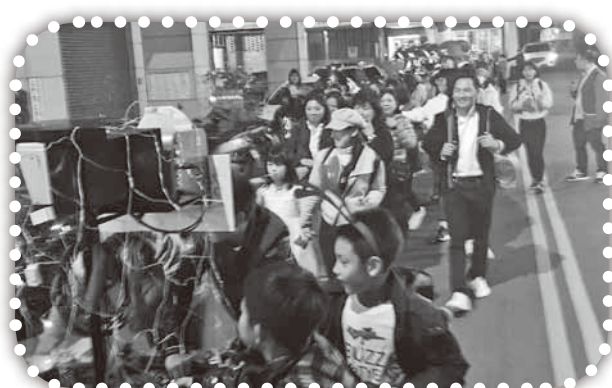
▲聖誕節在竹南遊行。