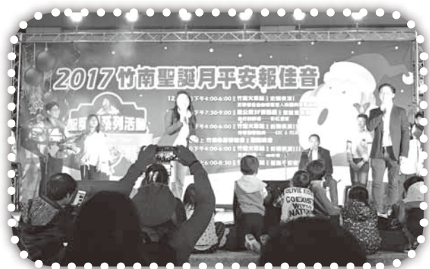
▲新加坡團隊唱聖誕組曲。