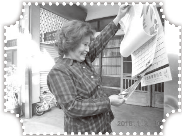
▲以福音月曆祝福村民。