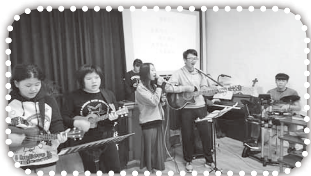
▲越來越老練的敬拜團。